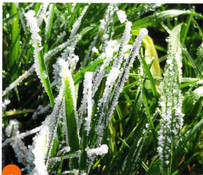
Feuille de gazon gelée.

Toutes les mesures permettant de réduire le trafic en cas de gel, de dégel ou de fortes pluies sont essentielles pour conserver de bonnes conditions de jeu et éviter des remises en état longues et coûteuses au printemps (sans compter les mauvaises herbes).