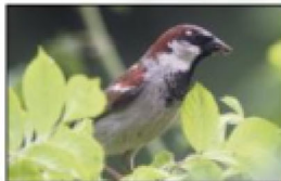
Vogel des Jahres Seite 11

Fridolins Satzkiste Wussten Sie, dass der älteste Baum eine Fichte aus Schweden mit einem Alter von über 9500 Jahren ist?