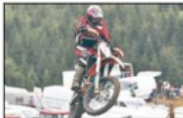
Benefiz-Motocross Fricktal Seite 17