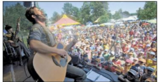
Lilibiggs-Kinder-Festivals, das Festivalprogramm für Familien