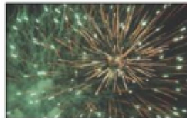
1.-August-Feiern im Fricktal Seite 3